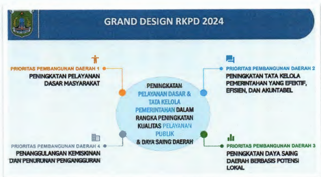
Gambar 1. Grand Design RKPD Tahun 2024

Berikut adalah Grand Design RKPD Tahun 2024, secara umum Sekretariat Daerah berfungsi sebagai pendukung yang melakukan sinkronisasi dan koordinasi sebagaimana telah diuraikan di atas.