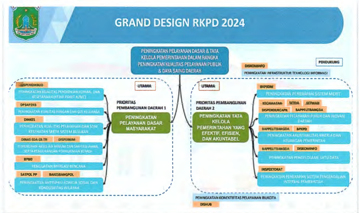
Gambar 2. Keselarasan Fokus Pembangunan Kabupaten Pasuruan dengan Renja Sekretariat Daerah

Adapun Keselarasan Fokus Pembangunan Kabupaten Pasuruan dengan Rencana Kerja (Renja) Sekretariat Daerah dapat dikemukakan dalam skema sebagai berikut :